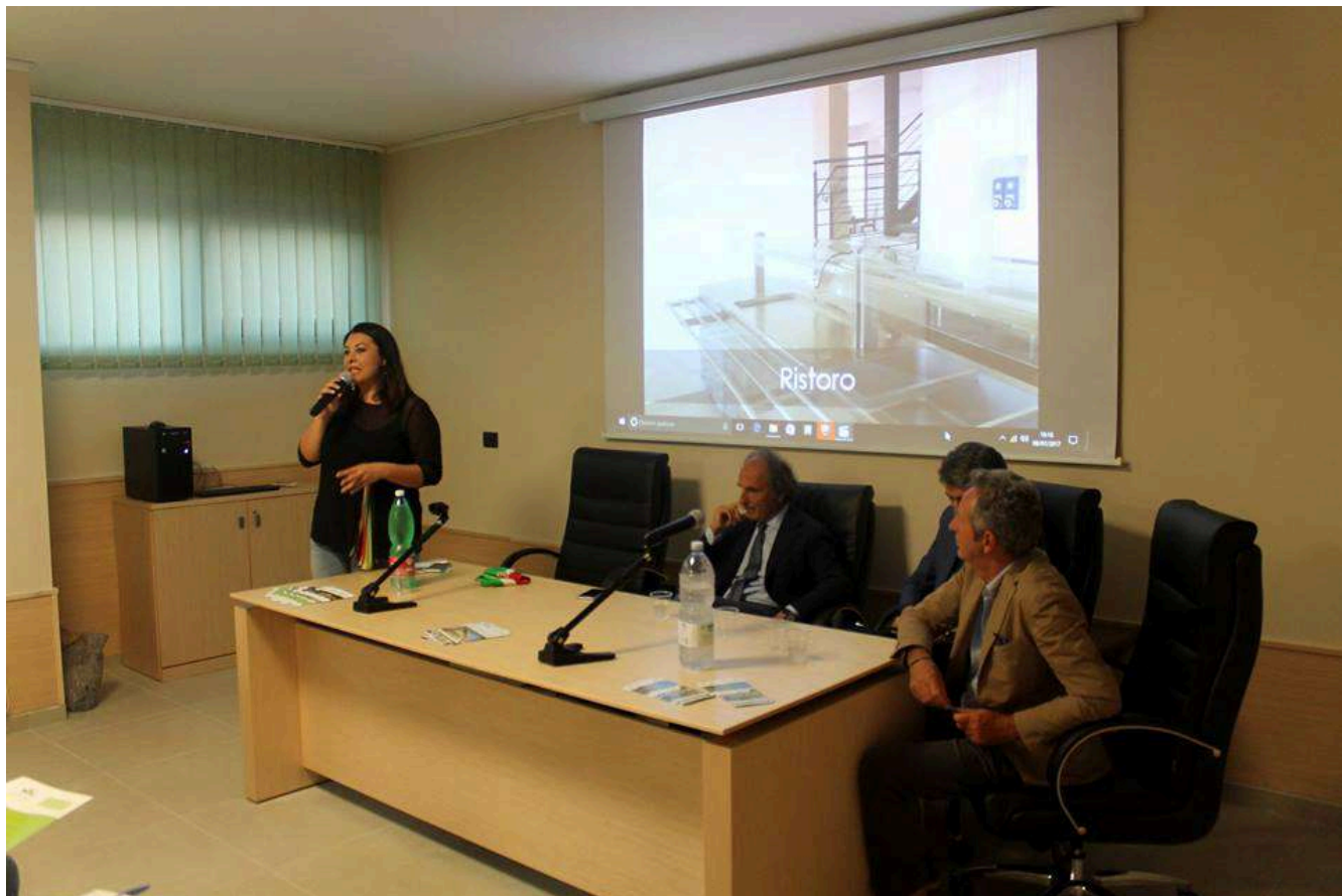
FOTO 7, 8, 9, 10, 11 - LA STRUTTURA ALL'INTERNO