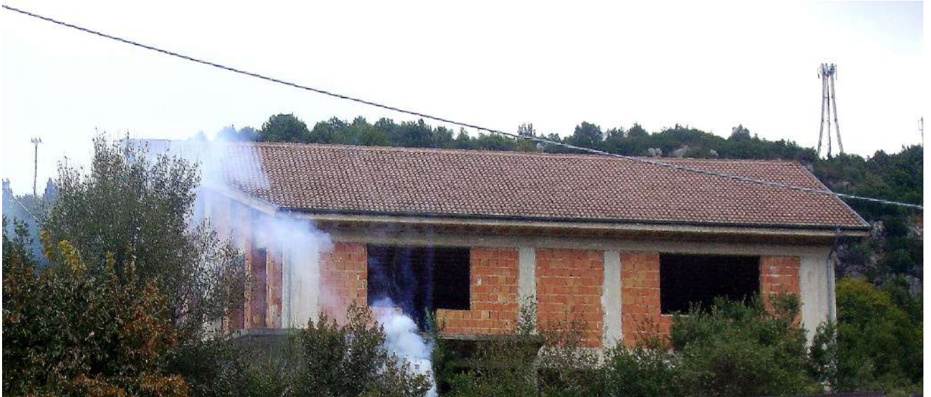
FOTO 2 - COM'ERA PRIMA DEI LAVORI