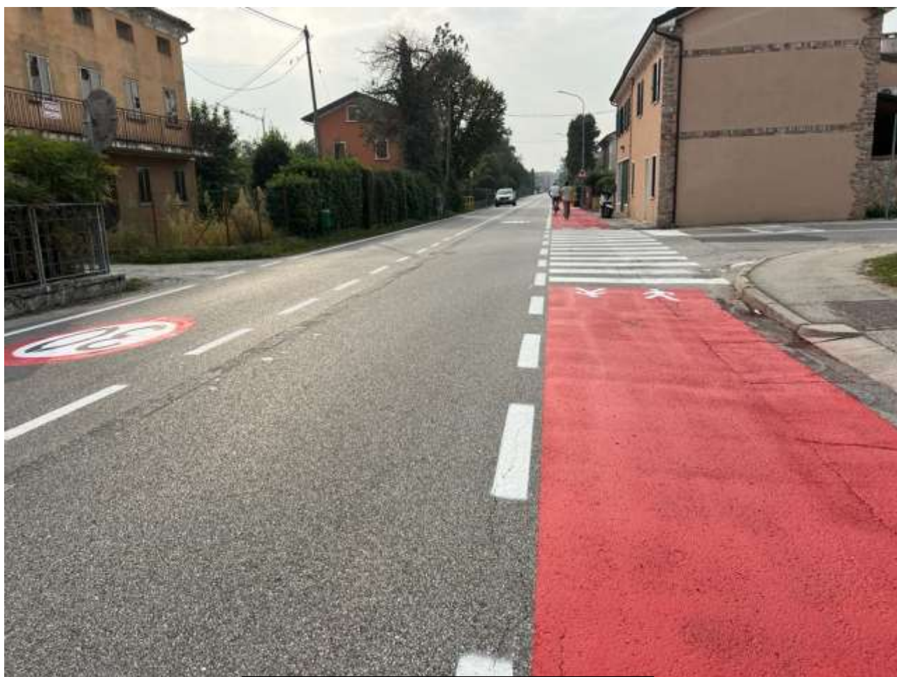
Didascalia: intervento del PEBA in Via Roma

L'attuazione del P.E.B.A. permetterà di abbattere le barriere architettoniche nelle zone di criticità emerse dallo studio dell'intero territorio comunale attuando in questo modo le politiche di inclusione sociale. Aspetto importante che vede anche le persone con disabilità poter usufruire dell'iniziativa "Bike to work" muovendosi a piedi o accompagnati per raggiungere il luogo di lavoro o la fermata dei mezzi di trasporto pubblici accumulando "Ecopunti".