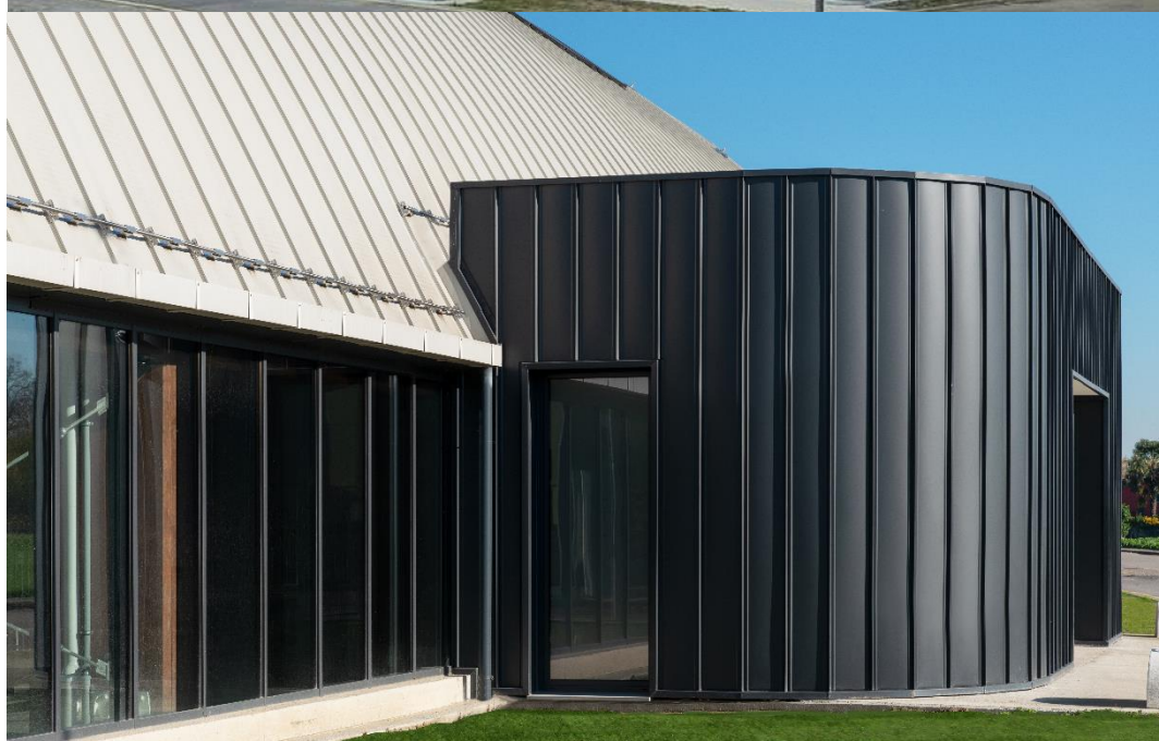
Copertura con l'installazione dei pannelli fotovoltaici